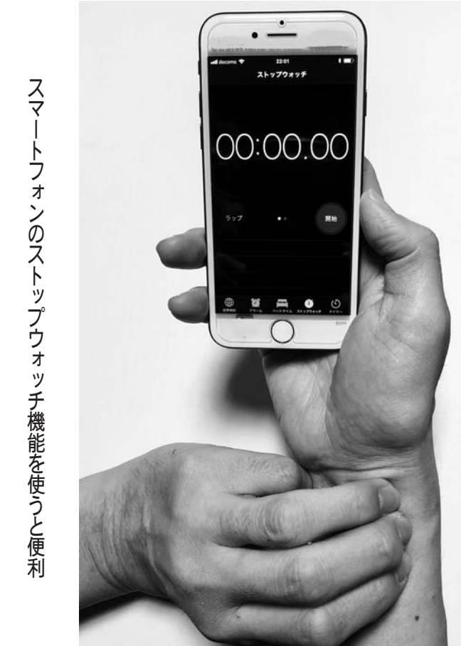
スマートフォンのストップウォッチ機能を使うと便利