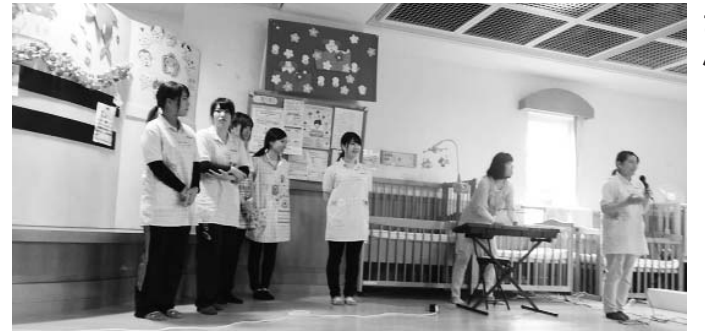
幼児遊びを指導する先生さん

たときにはお手伝いしてくれます。お母さんが病院に行くとき、残業で保育園の迎えに間に合わない、子育て中の困ったとき、困ったことをサポートしてあげたい。依頼会員と援助したい「支援会員」を登録して置いて、子育てのサポートを紹介し、顔見知りになり、援助活動が行われます。