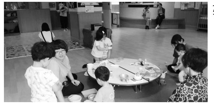
のびのびと遊ぶ子どもたち

今月のひとこと 公共の子育て支援にはさまざまな種類があるので、上手に利用しましょう。特に健康診査制度は、子供の健康や子育てで困ったときの相談窓口になります。