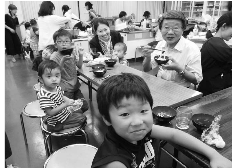
笑顔が広がる「こども食堂」